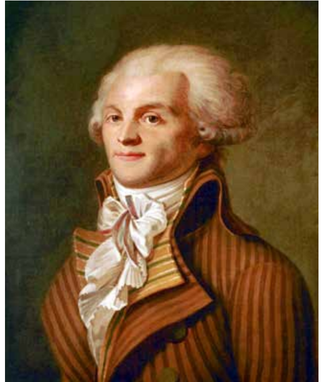
Maximilien de Robespierre Ecole française du XVIIIe s.

Les révolutions française et américaine furent ainsi, initialement, l'œuvre d'hommes fermement convaincus de ne rien faire d'autre que restaurer un ordre ancien, bafoué par la monarchie absolue ou le pouvoir colonial, et qui avaient peut-être un peu perdu de vue que la parfaite transparence des relations humaines va de pair