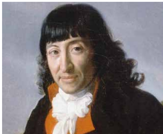
Louis-Marie de La Révellière-Lépeaux par Gérard

En France, la question de la légitimité du pouvoir