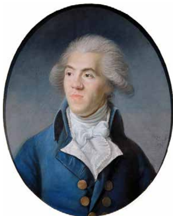
Antoine-Pierre-Joseph-Marie Barnave par Joseph Boze

Si la question de l'équilibre des pouvoirs pour garantir la liberté du citoyen dans le régime à créer a beaucoup