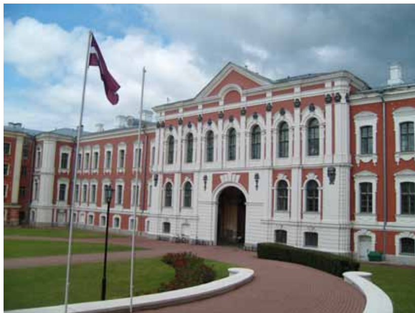
Château de MITAU

Cette Duchesse, née Anne-Charlotte-Dorothee de Médem le 03 février 1761 à Mé-