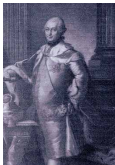
Pierre, Duc de Courlande

gante bâtisse chargée d'histoire, un joyau d'architecture baroque et de style rococo, qui a retrouvé récemment sa splendeur grâce à un long et persévérant travail de restauration de son conservateur et directeur actuel, Monsieur Imants Lancmanis. Avec ses 138 pièces et, notamment, les décorations somptueuses de la « salle blanche » et de la « salle dorée », ce château rappelle les plus prestigieux palais de l'époque tsariste. Sans oublier, bien sûr, les jardins à la française, avec son