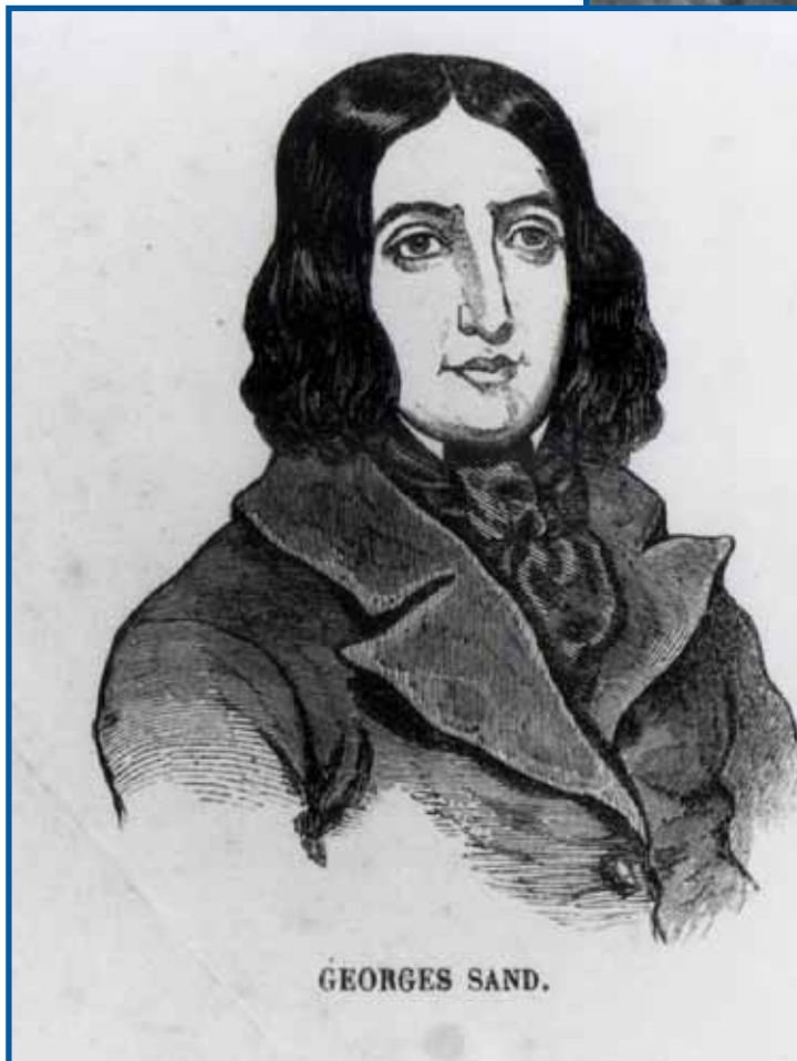
Georges (sic) Sand : lithographie anonyme collection particulière