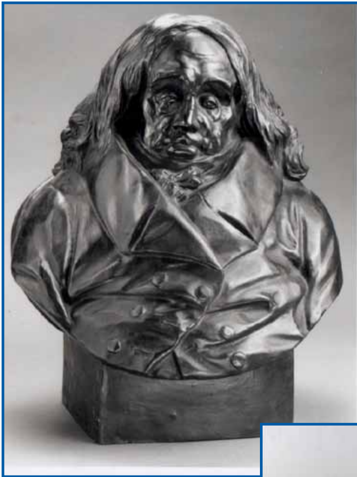
Buste Talleyrand :

«Dantan-Talleyrand-musée-du Louvre»