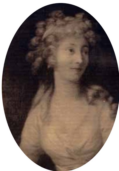
Anne-Charlotte Dorothée, Duchesse de Courlande

siècle, puis devenue au 17 ème siècle capitale du duché de Courlande. Le château, construit en 1738 par l'architecte Rastrelli, est imposant. La crypte abrite les caveaux de la famille des Courlande. C'est aujourd'hui