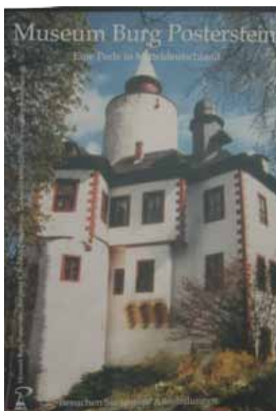
Musée de Posterstein