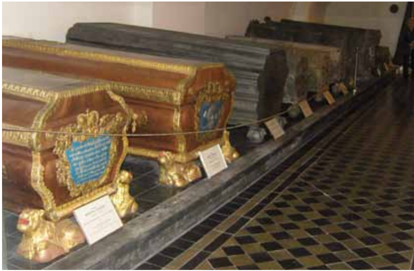
Château de MITAU - Crypte

est Riga, 800 000 habitants. Après une longue période de soviétisation (1944-1990), la Lettonie est redevenue indépendante en 1991 et a adhéré à toutes les organisations internationales, dont l'Union Européenne à partir de mai 2004.