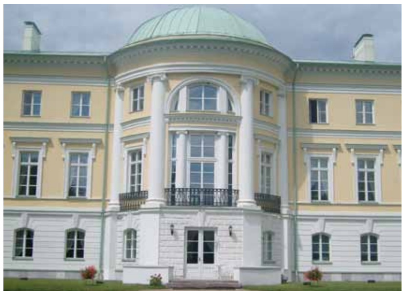
Château de Mezothene

-Jelgava, anciennement Mitau, fondée par les ancêtres des Von Medem au 13 ème