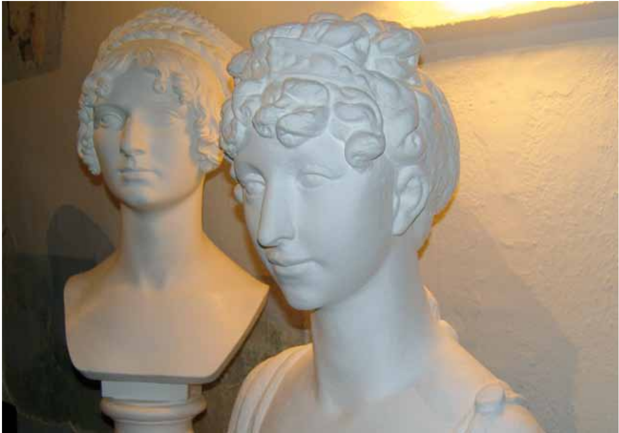
Anna Dorothea duchesse de Courlande