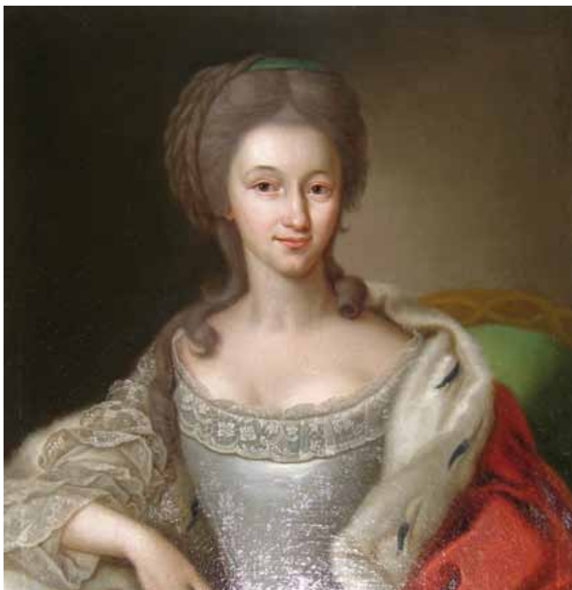
Anna Dorothea duchesse de Courlande