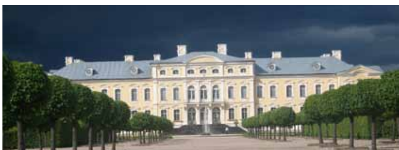
Palais de Rundale