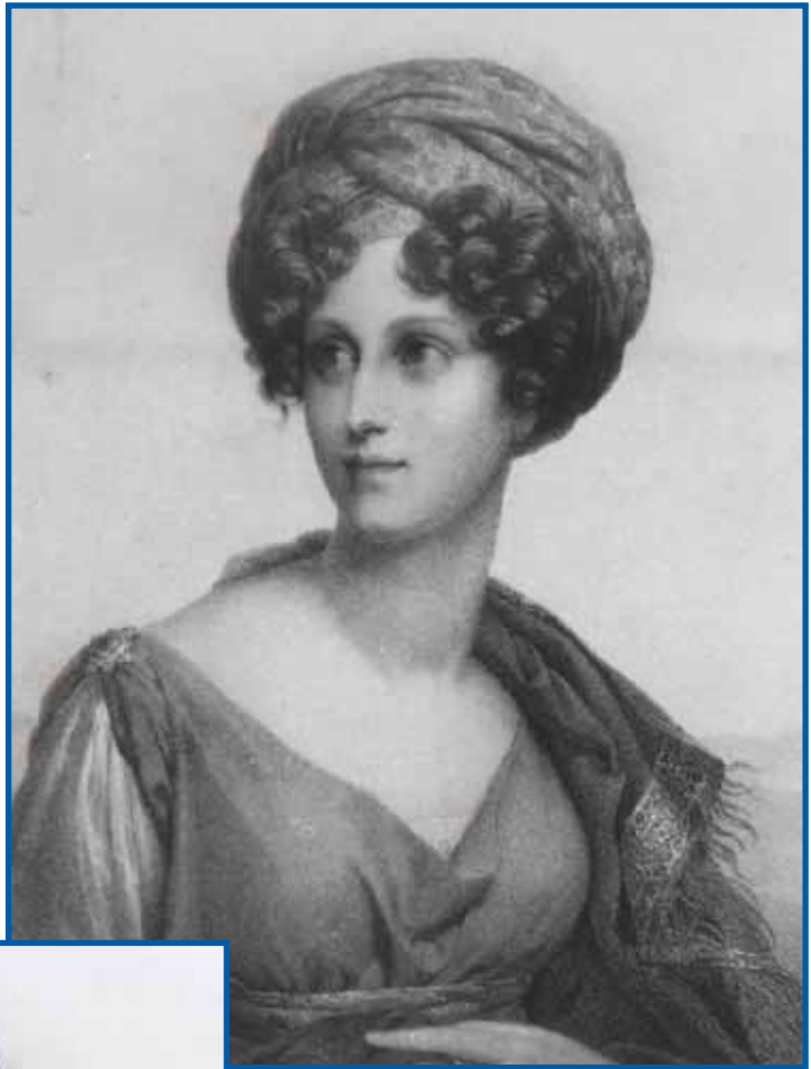
Duchesse de Dino : Gravure par Gérard d'après une peinture d'Isabey collection particulière