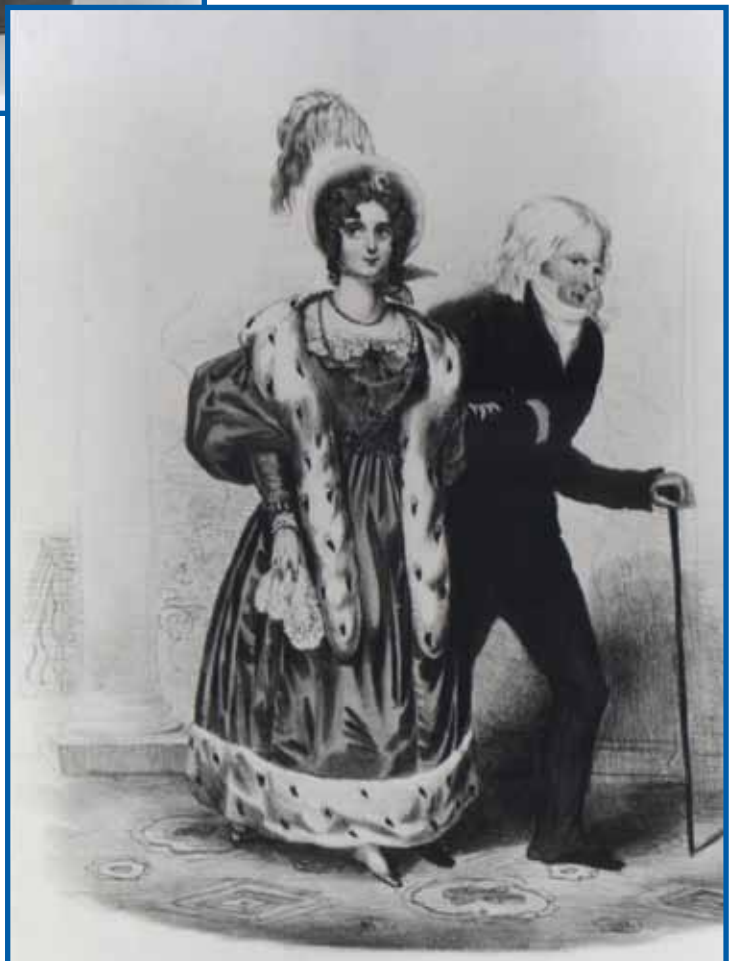
Couple Talleyrand-Dino :

«Dantan-Talleyrand-musée-du Louvre»