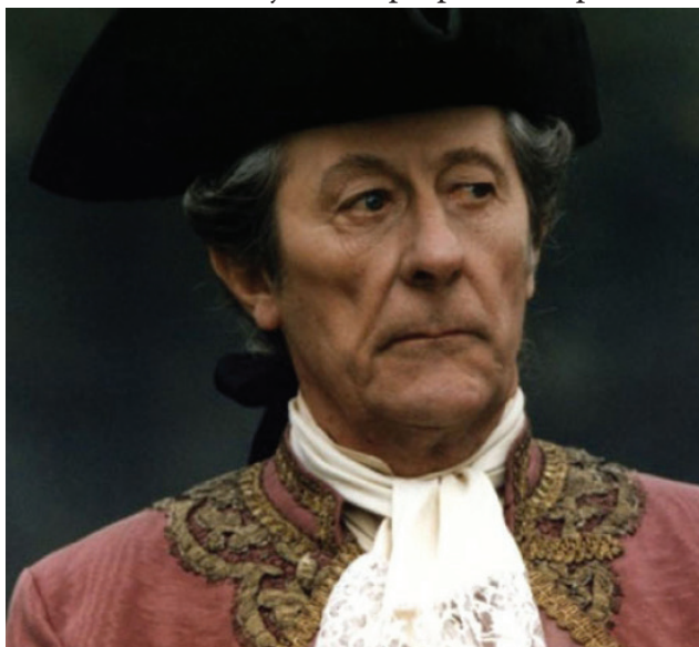
Jean Rochefort dans «Ridicule»

Dans cet article, je vous propose des pistes, et