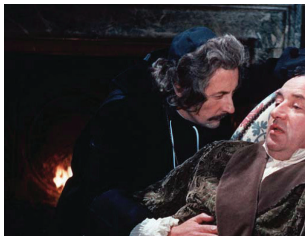
Jean Rochefort et Philippe Noiret dans «Que la fête commence»

Voici une autre version de cette histoire rattachée