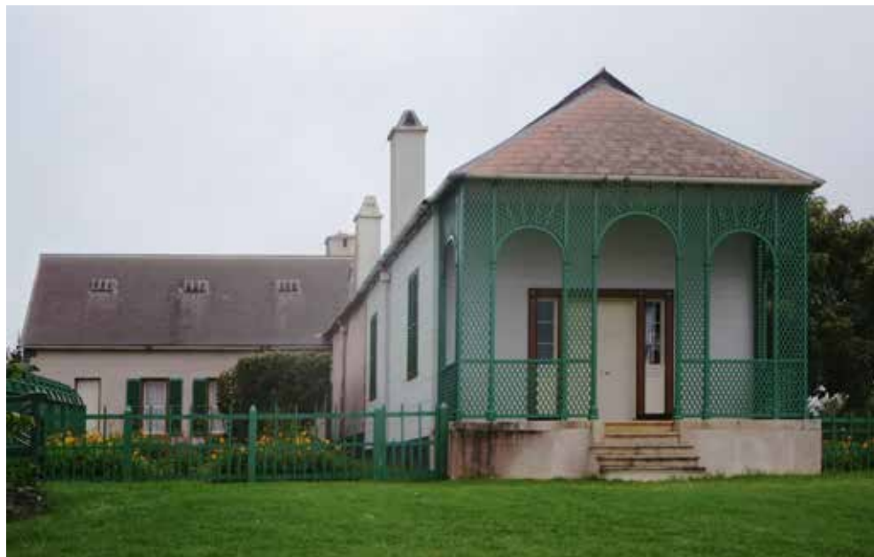
Longwood House, la maison de Napoléon à Sainte Hélène

- Dans son intimité, il parlait volontiers et gaiement de la profession ecclésiastique. Il réprouvait un jour un air que l'on fredonnait devant lui. Il l'avait en horreur, disait-il ; il lui rappelait le temps où on le forçait de chanter au lutrin.