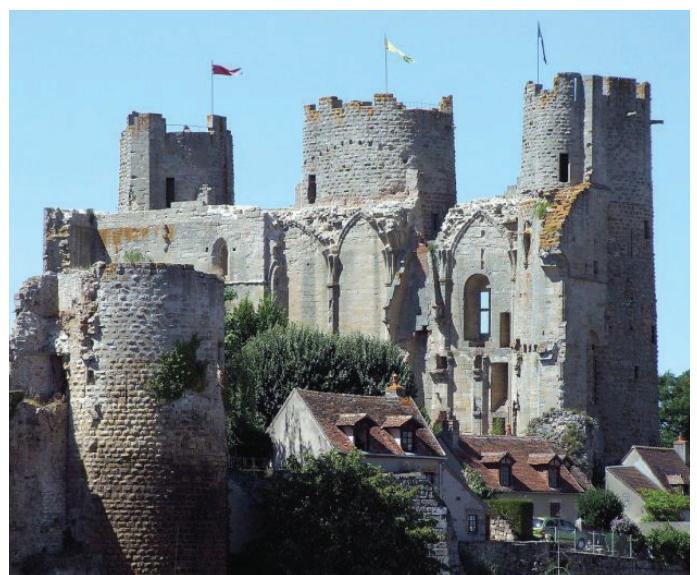
La forteresse des Bourbons