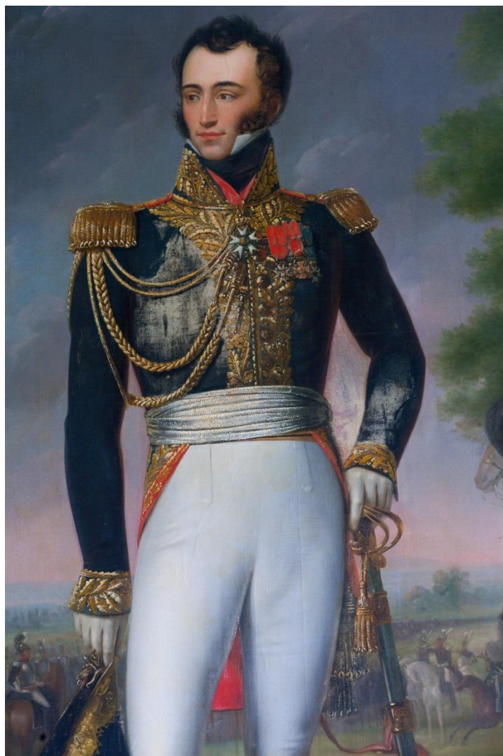
Figure 5 : Edmond de Périgord, tableau huile sur toile par Joseph Chabard entre 1810 et 1816, aujourd'hui au Château de Valençay.

l'acteur Ludwig Devrient, J. E. Bode, l'écrivain Johann Gottfried Schink, les frères Humboldt. Surtout avec Alexander von Humboldt, Dorothee entretenait une longue correspondance, à Sagan existaient 114 lettres d'Humboldt jusqu'en 1945.