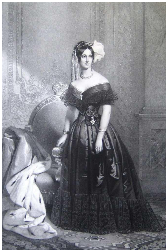
Figure 9 : lithographie d'Hermann Eichens d'après le tableau de Claude -Marie Dubufe 1841 jadis au château de Sagan.

Remerciement : l'auteur témoigne sa reconnaissance pour l'autorisation de reproduire les figures provenant des sources publiques ou privées, qu'elles soient mentionnées ou non.