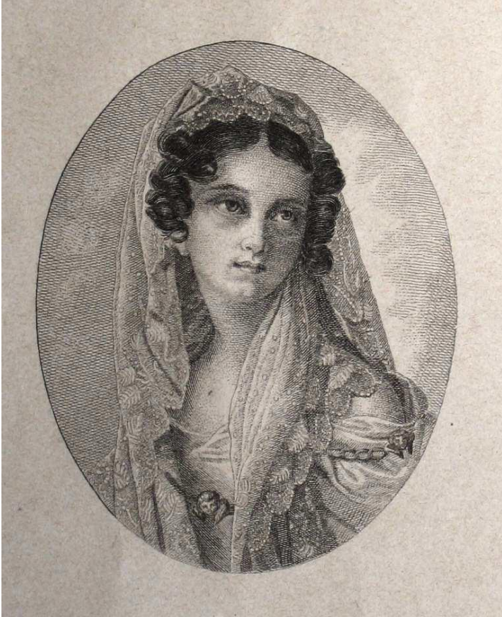
Figure 1 : portrait de Dorothee de Périgord, 1815, gravure d'après une miniature de Filippo Agricola faite pendant le Congrès de Vienne, frontispice du tome 1 de la Chronique .

Ayant juste 21 ans Dorothee fut choisie par son oncle Charles Maurice de Talleyrand comme première dame de son ambassade au Congrès de Vienne. Sa nièce bien aimée, et non son épouse la Princesse de Talleyrand, l'énigmatique Catherine Grand. Cette alternative ne semblait même pas exister dans ses pensées. Et lui-même écrit sur son choix dans ses mémoires : « Il me paraît aussi qu'il fallait faire revenir la haute et influente société de Vienne des préventions hostiles que la France impériale lui avait inspirées. Il était nécessaire pour cela de lui rendre l'ambassade française agréable ; je demandai donc ma