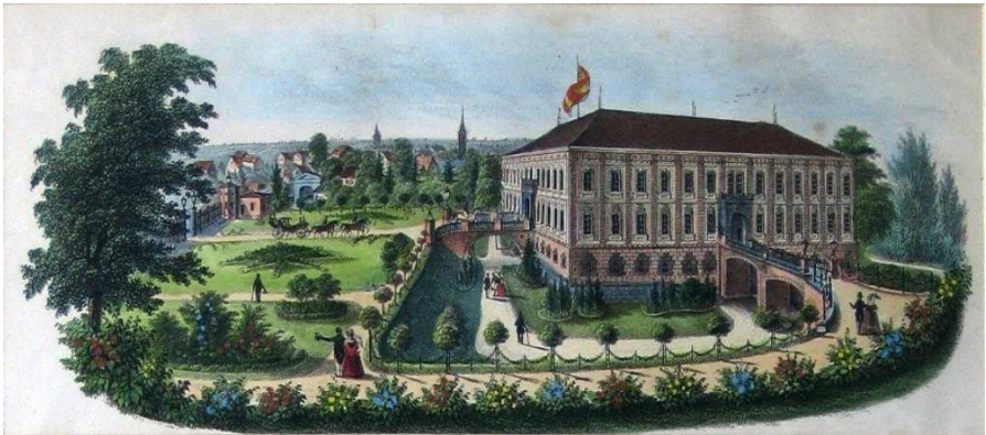
Figure 8 : le château de Sagan vu du nord, chromolithographie de Th. Hennicke vers 1847.

Dorothee nous laisse beaucoup de témoignages de son goût, de ses talents et de sa charité en France et en Prusse. Sous son règne le duché de Sagan connût une ère de bonheur et de bienfaisance, malgré les circonstances politiques et économiques mouvementées. Nous mentionnons ici seulement sa fondation de l'hôpital Dorotheenstift à Sagan en 1851 qui fut achevé en 1859 et qui sert encore aujourd'hui d'hôpital. 23 Dorothee était une grande passionnée d'horticulture et de parcs. Le jardin de la duchesse à Valençay, le parc de Rochecotte et le parc à Günthersdorf d'après Peter Joseph Lenné en témoignent amplement.