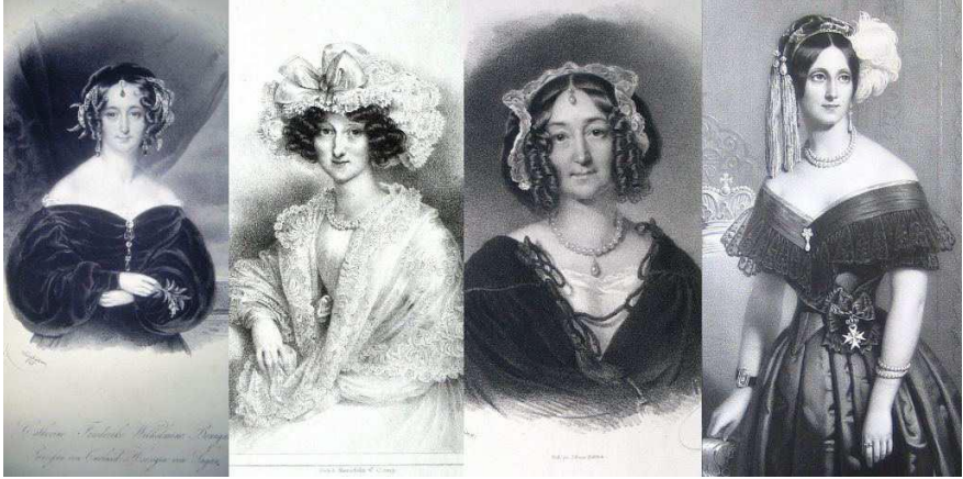
Figure 4 : la ressemblance entre les grâces de Courlande : Wilhelmine, détail de la lithographie de Josef Kriehuber 1841 d'après une miniature de Moritz Daffinger 1827; Pauline, détail d'une lithographie de Melegh 1845 d'après Ender; Jeanne, détail d'une lithographie de Kriehuber 1840 d'après un tableau de Schrotzberg ; Dorothée, détail de la lithographie de Hermann Eichens, voir Figure 9.

Pierre régnait durant 26 années en Courlande et garantissait une paix relative à son duché, un phénomène bien exceptionnel dans une région fortement troublée par les grandes puissances, à savoir la Russie, la Prusse, l'Autriche et la Suède. Le troisième partage en 1795 efface la Pologne de la carte d'Europe. Le suzerain de la Courlande, le roi Stanislas August II de Poniatowski de la Pologne et de la Lituanie, se voit obligé d'abdiquer, ainsi que Pierre en tant que duc de Courlande. La Courlande devient alors partie des provinces baltes de la Russie.