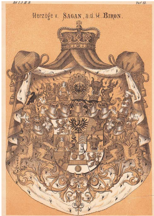
Figure 7 : blason ducal de Dorothée du 6 janvier 1845 d'après le nouveau Siebmacher 19 . Description de l'écu de cœur 1 – 4 : (1) S +

Wilhemine de 29 novembre 1839 18 , Sagan revint à sa sœur Pauline, princesse de Hohenzollern-Hechingen, qui ne s'en occupait guère. Dorothée dû constater l'état triste du château et des terres lors de son premier retour le 21 juin 1840. Après trois années de négociations avec son neveu Constantin de Hohenzollern-Hechingen, le contrat fut conclu le 16 octobre 1843 qui déclarait Dorothée propriétaire des terres (23000 ha, 20300 ha bois) du duché de Sagan à partir du 1 er janvier 1844. Finalement, le 6 janvier 1845 le roi Frédéric-Guillaume IV la reconnaît pour duchesse de Sagan avec droit de succession du fief pour ses fils.